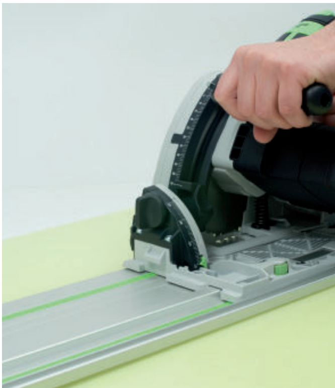
Aussparungen und Öffnungen in den Schnittkantenecken stets vorbohren und mit einer Stichsäge oder Oberfräse herausarbeiten.