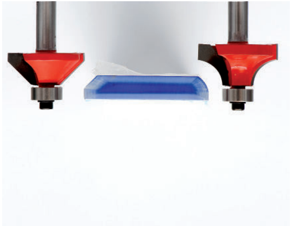
Fräser mit Kugellager benötigen keine zusätzlichen Führungsmittel und können, sowohl bei geraden, als auch bei geschweiften Kanten eingesetzt werden.