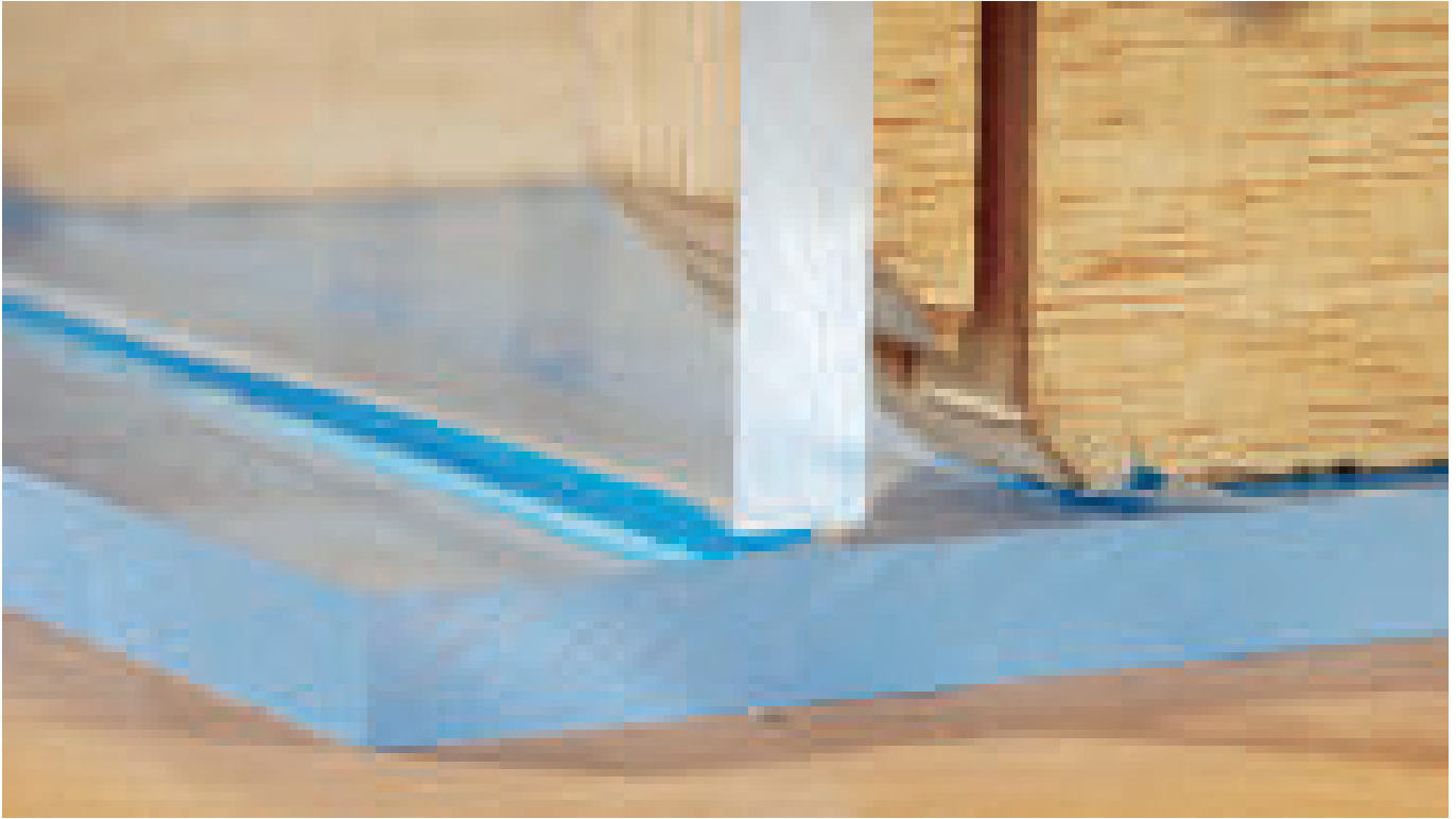
ACRIFIX® 1R 0192 kriecht selbständig in den Klebespalt hinein.