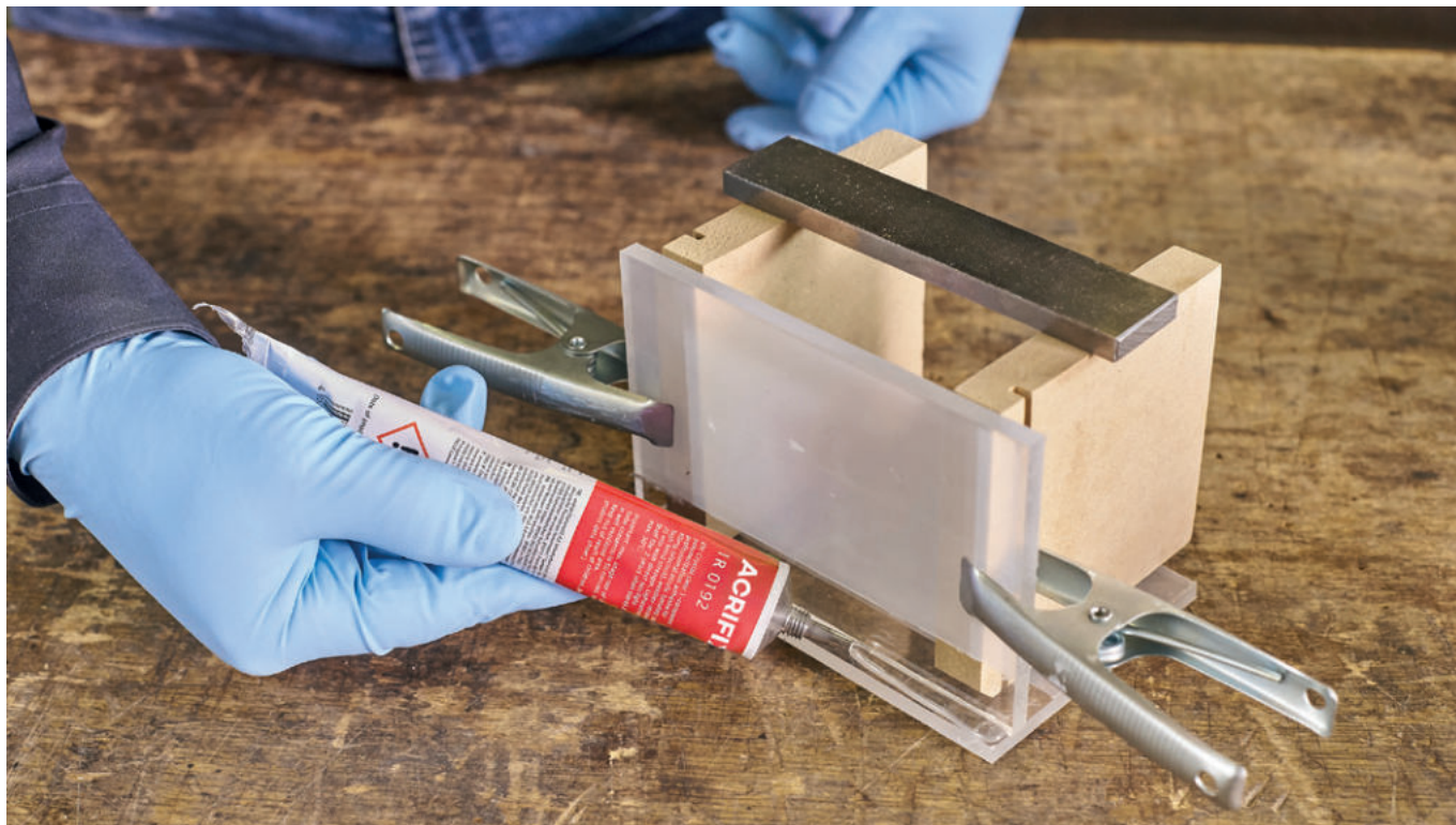
PLEXIGLAS® Platten lotrecht verkleben mit fugenfüllendem ACRIFIX® 1R 0192