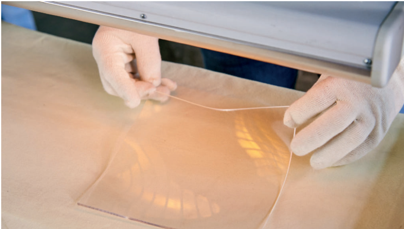
Die zugeschnittene PLEXIGLAS® Platte wird zum Erwärmen unter dem Badstrahler positioniert.