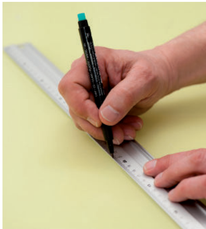
Aussparungen und Öffnungen auf der Folie anzeichnen und in den Schnittkantenecken stets vorbohren.